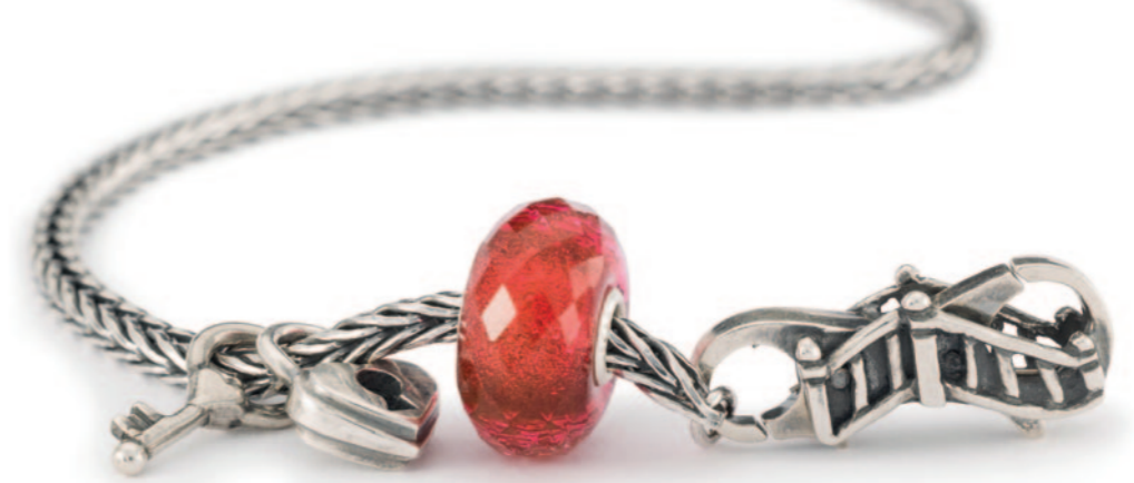
Altid sammen armbånd Vores forhold bygger på vores kærlighed og tillid og holdes sammen af vores venskab.