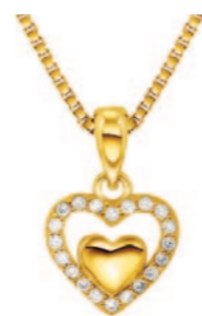
Sølv forgyldt vedhæng incl. kæde. Kr. 399,-