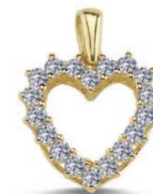
14 kt. med 0,54ct. -Vejl.uds.: kr. 12.600,-

Nuran laver fine hjertevedhæng i 14 kt. guld med brillantslebne diamanter i mange forskellige designs. Vi har samlet nogle af vores yndlingshjerter til jer lige her.