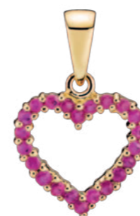
Vedhæng hjerte m. rubin 10x12mm, 8 karat guld 2.225 kr.