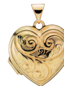
Vedhæng medaljon hjerte m. mønster 18mm, 8 karat guld 2.225 kr.