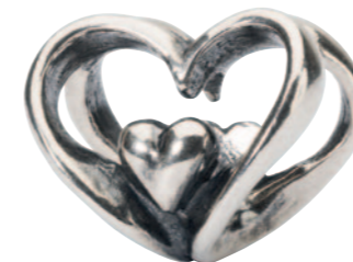
Hjerte til hjerte Selv når vi er adskilt, er vi altid tæt på hinanden.