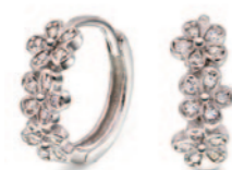
Rhod. kreoler i sølv. Kr. 229,-