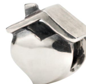
Hjem er hvor hjertet er.