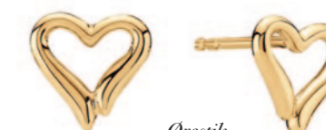
Ørestik m. hjerte, 8 karat guld 1.500 kr. Nyhed!