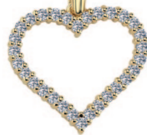
14 kt. med 0,30ct. Vejl.uds.: kr. 7.500,-

- og en måned, hvor mange går på knæ for at erklære deres kærlighed