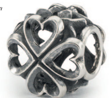
Hjerternes møde Vi er et perfekt match!