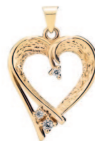
Vedhæng hjerte 22x17mm m. diamanter 0,06CT W.SI, 14 karat guld 5.995 kr.

Det har Lund Copenhagen vidst i mange år og utrætteligt år efter år sendt nye smykkedesigns med fortolkninger af kærlighedssymbolet hjertet på markedet. Vi viser her bare et lille udvalg af de nyheder og populære hjertesmykker, som helt sikkert kommer til at ligge under juletræet i flere hjem i år.