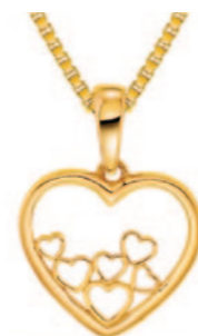
Guld vedhæng incl. kæde. Kr. 1.475,-