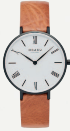
FOLIE LILLE - TAWNY KR. 1299,-