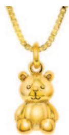
Sølv forgyldt vedhæng incl. kæde. Kr. 419,-