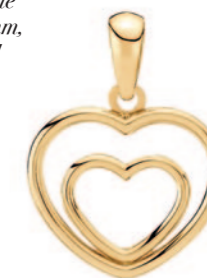
Vedhæng dobbelt hjerte 18x13mm, 9 karat guld 1.125 kr. Nyhed!