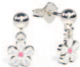
Ørepynt hvid emalje. Kr. 285,-