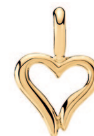
Vedhæng hjerte, 8 karat guld 1.025 kr. Nyhed!