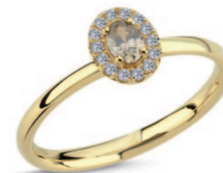
Champagne ring 14 kt. med 1 x 0,17ct. champagnefarvet diamant samt 0,07ct. Wesselton Si brillanter. Vejl.uds. kr. 7.975,-