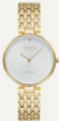
DIAMANT - CIDER KR. 1199,-