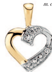
Vedhæng hjerte m. diamanter 7x0,004CT TC.P2, 14 karat guld 1.975 kr. Nyhed!