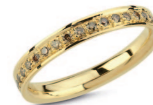
Champagne ring 14 kt. med 35 x 0,01ct. champagnefarvede diamanter. Vejl.uds. kr. 8.550,-