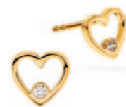
Guld ørestikk. Kr. 1.775,-