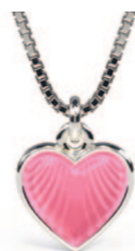
Sølv vedhæng incl. kæde. Lyserød emalje. Kr. 435,-