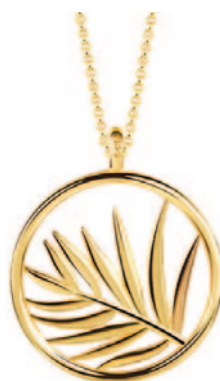
Sølv forgyldt vedhæng incl. kæde. Kr. 590,-