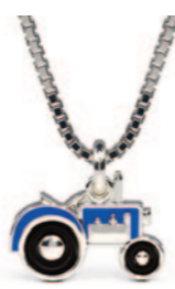
Sølv vedhæng incl. kæde. Blå emalje. Kr. 435,-