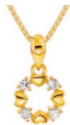
Sølv forgyldt vedhæng incl. kæde. Kr. 379,-