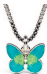
Sølv vedhæng incl. kæde. Turkis emalje. Kr. 435,-