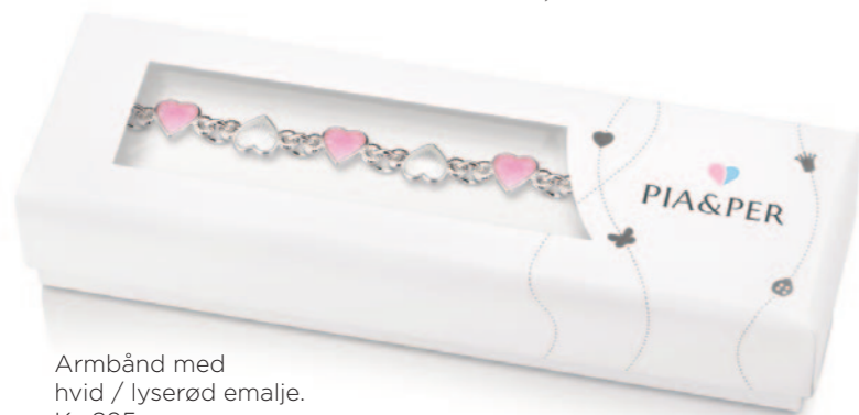
Armbånd med hvid / lyserød emalje. Kr. 895,-