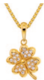
Guld vedhæng incl. kæde. Kr. 2.215,-