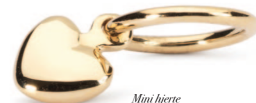
Mini hjerte Kærlighed deler sig ikke, men formerer sig.