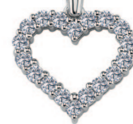
14 kt. med 0,36ct. Vejl.uds.: kr. 8.600,-