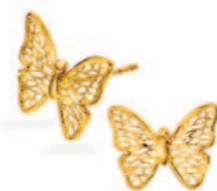
Guld ørestikk. Kr. 2.245,-