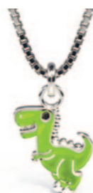
Sølv vedhæng incl. kæde. Grøn emalje. Kr. 435,-