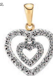
Vedhæng dobbelt hjerte 28x10,0036CT PC.P2, 14 karat guld 4.900 kr. Nyhed!