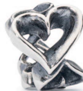
Hjerte i massevis Da jeg mødte dig, begyndte mit hjerte at slå.