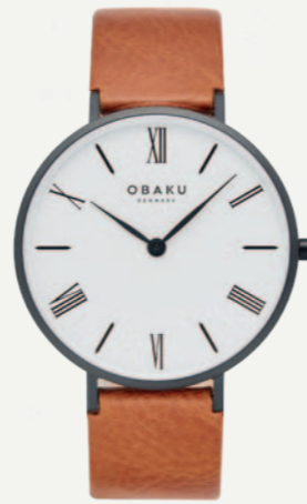
FOLIE - TAWNY KR. 1299,-

Ole Brix Eftf. / Tlf. 70 25 32 22 / Mail. info@bonett.dk