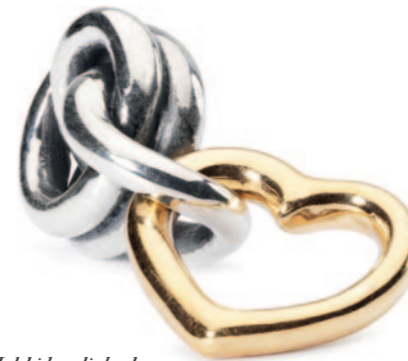
Held i kærlighed Vi har alle brug for lidt held i kærlighed.