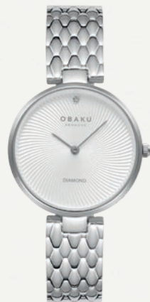
DIAMANT - BRACE KR. 999,-