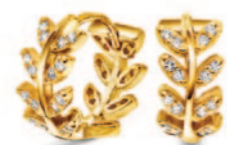
Forgylde kreoler i sølv. Kr. 299,-