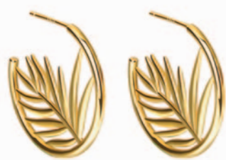
Sølv forgyldt ørepynt. Kr. 660,-